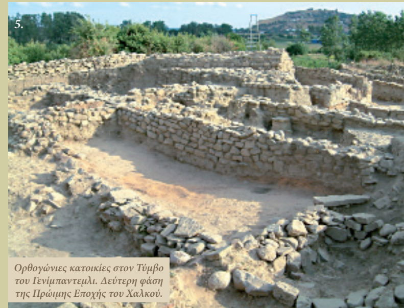
5. Ορθογώνιες κατοικίες στον Τύμβο του Γενίμπαντεμλι. Δεύτερη φάση της Πρώιμης Εποχής του Χαλκού.

ένα μεγάλο μέρος της οποίας διασώζεται στο βόρειο άκρο, έχει διάμετρο 3,65 μ. και βάθος 2 μ. Πιθανότατα καλυπτόταν από επάνω με υλικά, όπως κλαδιά και καλάμια. Την «οικοσκευή» της αποτελούσαν γαβάθες, στάμνοι και τρίποδα αγγεία, όστρακα μαλακίων, οστά και κέρατα ελαφιών. Η κατεργασία της πέτρας φαίνεται ότι περιοριζόταν σε λίθινα εργαλεία που χρησιμοποιούνταν για τη λείανση των αγγείων, χειρόμυλους που χρησίμευαν στην προπαρασκευή της τροφής και πέτρινα τσεκούρια με οπή στην οποία προσαρμόζονταν τα στείλιάρια. Τα τσεκούρια αυτά προτιμούνταν στις ξυλουργικές εργασίες. Η κατασκευή όλων αυτών των πέτρινων εργαλείων δεν φανερώνει ένα υψηλό επίπεδο τεχνολογίας, ενώ ανάλογη κατάσταση παρατηρείται και στα εργαλεία της κατεργασίας οστών. Τα αρχιτεκτονικά κατάλοιπα που εντοπίστηκαν στην επίχωση στους βράχους του Γενίμπαντεμλι προέβλεπαν ένα σκηνικό που τεκμηριώνει ότι είχαν λάβει χώρα τα πρώτα βήματα αστικοποίησης και ότι σταδιακά γινόταν η μετάβαση στη δομή ενός σχεδιασμένου οικισμού. Στα ανώτερα στρώματα που ανασκάφηκαν σε ευρεία κλίμακα, μαζί με τις ορθογώνιες κατοικίες (Εικ. 5) εντοπίστηκαν και κτίσματα με τον ένα τους τοίχο