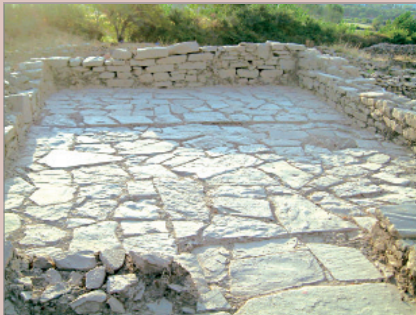
1. Εσωτερική άποψη του παρεκκλησίου.

Το 2010 ήρθαν στο φως στο ψηλότερο τμήμα του λοφίσκου τα απομεινάρια ενός κτίσματος (Εικ. 1) που από κατοίκους του νησιού χαρακτη-