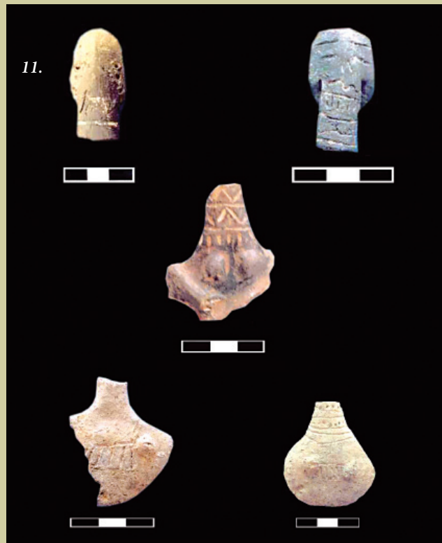
Ειδώλια με διακόσμηση στο λαιμό που βρέθηκαν στον Τύμβο του Γενίμπαντεμλι. Δεύτερη φάση της Πρώιμης Εποχής του Χαλκού.

και τα εργαλεία που χρησιμοποιούνταν στη βυρσοδεψία ενίσχυσαν την άποψή μας ότι η κατασκευή κοσμημάτων ήταν ασήμαντη.