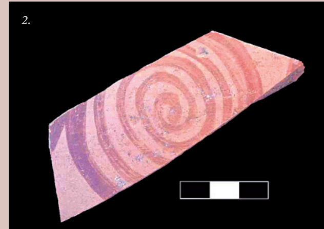
2. Όστρακο στάμνου με ελικοειδή διακόσμηση που βρέθηκε στον τύμβο. Ύστερη Εποχή του Χαλκού.

Τα αρχαιολογικά ευρήματα της περιόδου του δεύτερου πολιτισμού του Τύμβου του Γενίμπαντεμλί ή αλλιώς της Ύστερης Εποχής του