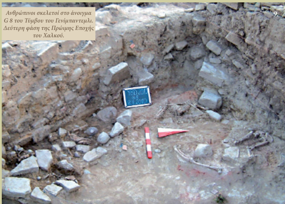
Ανθρώπινοι σκελετοί στο άνοιγμα G 8 του Τύμβου του Γενίμπαντεμλι. Δεύτερη φάση της Πρώιμης Εποχής του Χαλκού.

αρχίσει να χρησιμοποιείται στη δυτική Μ. Ασία, γεγονός που τοποθετείται στα μέσα της τρίτης χιλιετίας π.Χ.. Από όλους τους σεισμούς που έλαβαν χώρα κατά την εγκατάσταση στο Ηραίον ΙΙ της Σάμου (Milojčić, 1961:37, Lev. 12, 2) και την κίτρινη περίοδο της Πολιόχνης της Λήμνου (Bernabò-Brea, 1964:26), ή αλλιώς στο δεύτερο μισό της τρίτης χιλιετίας π.Χ., εκείνος που προκάλεσε ανθρώπινες απώλειες στο Γενίμπαντεμλι και θεωρείται παλαιότερος, δεν αποτέλεσε την αιτία εγκατά-