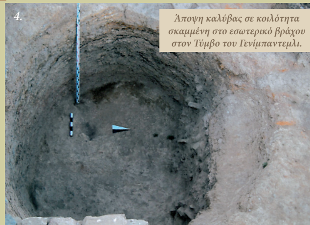
4. Άποψη καλύβας σε κοιλάττα σκαμμένη στο εσωτερικό βράχου στον Τύμβο του Γενίμπαντεμλι. Δεύτερη φάση της Πρώιμης Εποχής του Χαλκού.

Ο πολιτισμός της τρίτης περιόδου, ο οποίος απλώνεται σε ολόκληρη την έκταση του τύμβου και φανερώνει τον πραγματικό χαρακτήρα του Γενίμπαντεμλι, χρονολογήθηκε στη δεύτερη φάση της Πρώιμης Εποχής του Χαλκού ή αλλιώς στην εποχή της Τροίας Ι. Το Γενίμπαντεμλι που από τις αρχές του 3.000 π.Χ. και για 400 χρόνια κατοικήθηκε αδιάκοπα, είχε ρυμοτομία. Όπως συνέβη σε πολλούς οικισμούς του Αιγαίου, έτσι κι εδώ, ήρθαν στο φως τείχη που εντάσσονται στο αμυντικό σύστημα καθώς και μια πλακόστρωτη ράμπα που εξασφαλίζει την είσοδο στον οικισμό. Τα τείχη που προστάτευαν τον οικισμό από πιθανούς κινδύνους στην ανατολική, νότια και δυτική πλευρά είχαν χτιστεί εξ ολοκλήρου από πέτρες, ενώ η βόρεια πλευρά είχε αφαιρεθεί αψύλακτη. Όπως αποκάλυψαν και οι παλαιογεωγραφικές έρευνες, ένας κόλπος βάθους 16 μ. που απείχε 35-40 μ. από το βόρειο άκρο παρείχε φυσική προστασία. Υποθέτουμε ότι η απουσία οχύρωσης στη βόρεια πλευρά του λοφίσκου επέτρεπε στους κατοίκους του οικισμού να ελέγχουν τη θάλασσα και κρατούσε –με τους βόρειους ανέμους– μακριά από τον οικισμό τα κουνούπια που ζούσαν στις ελώδεις περιοχές της νότιας πλευράς. Οι πρώτοι κάτοικοι του πολιτισμού της δεύτερης φάσης της Πρώιμης Εποχής του Χαλκού –εποχή που εκπροσωπείται με τουλάχιστον 8 αρχαιολογικά στρώματα– κατοικούσαν σε καλύβες μέσα σε κοιλάττες σκαμμένες στο εσωτερικό βράχων. Μία τέτοιου είδους καλύβα (Εικ. 4) αποκαλύφθηκε στη βορειοανατολική πλευρά του τύμβου. Η κυκλικού σχήματος καλύβα,