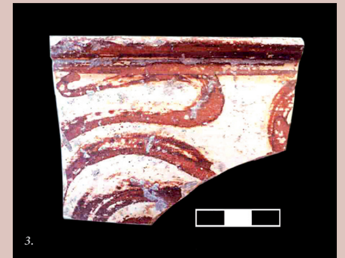
3. Όστρακο γαβάθας ή κύλικα διακοσμημένης με παράσταση χταποδιού που βρέθηκε στον τύμβο. Ύστερη Εποχή του Χαλκού.

πόσης που μπορεί να συνδέονται και με τη μινωική κεραμική παράδοση, έχουν γεννήσει το ερώτημα αν οι πραγματικοί τους κατασκευαστές θα μπορούσαν να έχουν εγκατασταθεί για μεγάλο διάστημα στον Τύμβο του Γενίμπαντεμλί. Δυστυχώς, τα μικρής κλίμακας αρχιτεκτονικά κατάλοιπα που εντοπίστηκαν στην περιοχή της ράμπας και είναι φτιαγμένα από κυκλώπειες πέτρες δεν απαντούν επαρκώς σε αυτό το ερώτημα. Επιπρόσθετα, ο μη εντοπισμός στον τύμβο χαρακτηριστικών αγγείων που χρησιμοποιούνταν εντός των κατοικιών των οικισμών της Ύστερης Εποχής του Χαλκού στο Αιγαίο και η απουσία μεγάλης ποικιλομορφίας τύπων αγγείων, αποτελούν απόδειξη ενός εποχικού καταφυγίου παρά μιας μόνιμης εγκατάστασης στο Γενίμπαντεμλί. Τα δείγματα κεραμικής με μυκηναϊκές και μινωικές επιρροές που βρέθηκαν