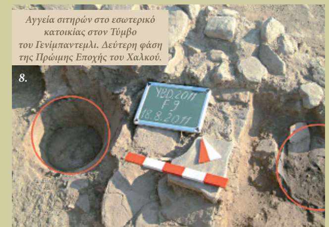
8. Αγγεία σιτηρών στο εσωτερικό κατοικίας στον Τύμβο του Γενίμπαντεμλι. Δεύτερη φάση της Πρώιμης Εποχής του Χαλκού.

των αποθηκευόταν, τοποθετούνταν σε μικρούς λάκκους που είχαν ανοιχθεί στο δάπεδο των κατοικιών (Εικ. 8). Σε ορισμένες δε περιπτώσεις, είχε χτιστεί ένα χαμηλό λίθινο τοίχιο τοξοειδούς σχήματος με σκοπό να στηρίζει το αγγείο που ακουμπούσε στη μια γωνία