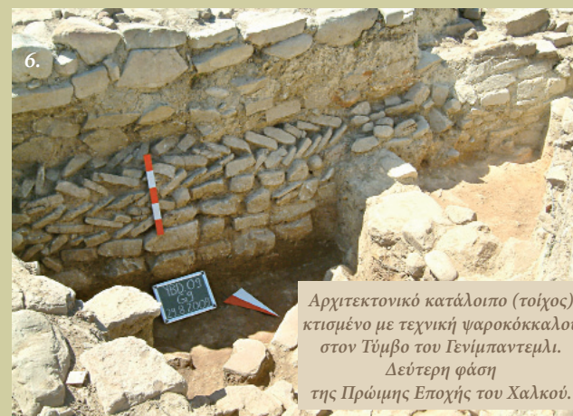
6. Αρχιτεκτονικό κατάλοιπο (τοίχος) κτισμένο με τεχνική ψαροκόκκαλου στον Τύμβο του Γενίμπαντεμλι. Δεύτερη φάση της Πρώιμης Εποχής του Χαλκού.

σε σχήμα «D». Εκτός από κτίσματα με πέτρινα θεμέλια και πλίνθινους τοίχους, στο Γενίμπαντεμλι βρέθηκαν και κατοικίες χτισμένες είτε εξολοκλήρου από πέτρα είτε με πέτρινους τοίχους μέχρι ένα ορισμένο ύψος και από εκεί και πάνω με πλίνθους. Οι κατοικίες αυτές είτε ήταν μονόχωρες είτε χωρίζονταν με ενδιάμεσους τοίχους. Η είσοδός τους βρισκόταν στη στενή πλευρά. Το εσωτερικό τους πλάτος κυμαίνεται σε 3,40 – 5,20 μ. και το σωζόμενο μήκος τους σε 7,50 – 10,40 μ., ενώ εικάζεται ότι είχαν επίπεδη στέγη. Σε αρκετά κτίσματα εντοπίστηκαν υποδοχές ξύλινων κιόνων (στύλων) που υποβάσταζαν τα ανώτερα στρώματα ή στοίβες από πέτρες που αποτελούσαν κρηπίδωμα για αυτούς τους κίονες. Τα κτίσματα του Γενίμπαντεμλι θυμίζουν τις συστοιχίες σπιτιών που είναι χαρακτηριστικό του Αιγαίου. Οι επιμήκεις τοίχοι μερικών από αυτά χρησιμοποιούνταν ως μεσοτοιχία. Η τεχνική τοιχοδομίας σε σχέδιο ψαροκόκκαλου (Εικ. 6) που εφαρμόστηκε σε ένα από τα κτίσματα εντοπίστηκε μονάχα σε ένα στρώμα. Η συγκεκριμένη τεχνική τοιχοδομίας που εί-