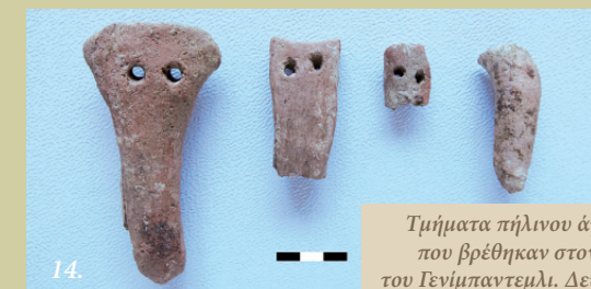
Τμήματα πήλινου άγκιστρου που βρέθηκαν στον Τύμβο του Γενίμπαντεμλι. Δεύτερη φάση της Πρώιμης Εποχής του Χαλκού.