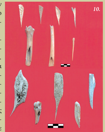
Οστέινα εργαλεία που βρέθηκαν στον Τύμβο του Γενίμπαντεμλι. Δεύτερη φάση της Πρώιμης Εποχής του Χαλκού.

οστέινα εργαλεία που από άποψη τεχνοτροπίας και τύπου δε φαίνεται να διαφέρουν από τα ευρήματα των υπόλοιπων κέντρων της Πρώιμης Εποχής του Χαλκού του Αιγαίου. Στη βυρσοδεψία χρησιμοποιήθηκαν εργαλεία όπως γλύφανα, βελόνες ραψίματος, κουτάλες και σπάτουλες που υποδεικνύουν ότι οι τότε τεχνολογικές γνώσεις μεταδόθηκαν και στη μετέπειτα εποχή. Οι ολιγάριθμες καρφίτσες που βρέθηκαν στον οικισμό