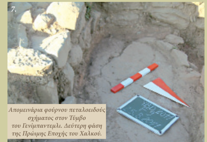
7. Απομεινάρια φούρνου πεταλοειδούς σχήματος στον Τύμβο του Γενίμπαντεμλι. Δεύτερη φάση της Πρώιμης Εποχής του Χαλκού.

ναι γνωστή κι από τον οικισμό της Τροίας Ι (Dörpfeld, 1902:47, Εικόνα 9) εντοπίστηκε και σε νησιωτικούς οικισμούς, όπως στη Θερμή Ι (Lamb, 1936:7, 15 vd., Lev. II, 1, 6) και τη Σκάλα Σωτήρος (Koukouli-Chrysanthaki, 1988:429, Lev. 8; 2004: 89, 93, Εικόνα 11), καθώς επίσης στον Άγιο Κοσμά (Lamb, 1936:7, Dn. 1) και την Εύτρηση (Goldman, 1931:15, 17, Εικόνα 12) στην ηπειρωτική Ελλάδα. Μέσα στα κτίσματα της δεύτερης φάσης της Πρώιμης Εποχής του Χαλκού του Γενίμπαντεμλι τα οποία είχαν πήλινο δάπεδο, εκτός από τους πεταλόσχημους (Εικ. 7) ή απιόσχημους φούρνους, εντοπίστηκαν και εστίες στρογγυλές ή σε σχήμα που θυμίζει το γράμμα «U». Τα αγγεία για τα σιτηρά που αποτελούν απόδειξη ότι το πλεόνασμα των προϊό-