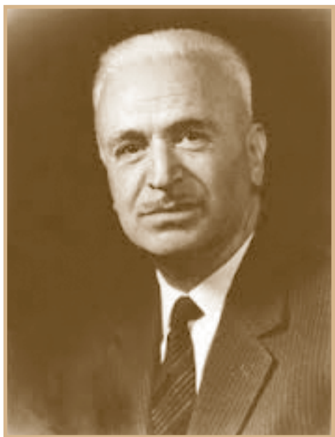
Ίμβρος, 8/11/1906 - Θεσσαλονίκη, 29/9/1976

Πολλά έχουν γραφεί για τον αιμνηστο συμπατριώτη μας Νικόλαο Π. Ανδριώτη, «την δρυ της Ελληνικής Γλωσσολογίας» όπως χαρακτηριστικά τον είχε αποκαλέσει ο μεγάλος Πανεπιστημιακός Δάσκαλος Α. Ι. Θαβώρης μετά τον θάνατο του πρώτου. Και είναι λογικό άλλωστε αφού πρόκειται για μια από τις σημαντικότερες προσωπικότητες που δεσπόζει ακόμα, μέσω των έργων του, στο χώρο της ελληνικής Γλωσσολογίας. Καθηγητής Γλωσσολογίας και Πρύτανης του Αριστοτελείου Παν/μίου Θεσσαλονίκης με λαμπρές σπουδές στα Πανεπιστήμια της Αθήνας, της Βιέννης και του Βερολίνου, Πρόεδρος του Ιδρύματος Τριανταφυλλίδη & του Ιδρύματος Μελετών Χερσονήσου του Αίμου, Συντάκτης του Ιστορικού Λεξικού της Ακαδημίας Αθηνών, κ.λπ. Υπήρξε ακάματος μελετητής της γλώσσας και πολυγραφότατος με δεκάδες πρωτότυπες γλωσσολογικές μελέτες στο ενεργητικό του, πολλές από τις οποίες έθεσαν τις