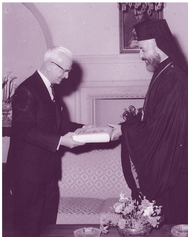
Βράβευση του Ν. Ανδριώτη από τον Μακάριο στην Κύπρο

40 ΧΡΟΝΙΑ ΑΠΟ ΤΟΝ ΘΑΝΑΤΟ & 110 ΧΡΟΝΙΑ ΑΠΟ ΤΗ ΓΕΝΝΗΣΗ ΤΟΥ ΜΕΓΑΛΟΥ ΙΜΒΡΙΟΥ ΓΛΩΣΣΟΛΟΓΟΥ